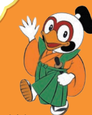
出水市 マスコットキャラクター つるのしん